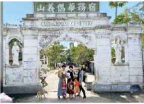
中国人墓地前にて