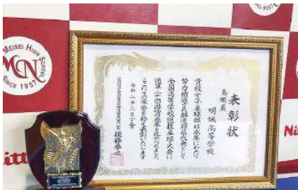
卓球全国選抜20回出場表彰

2011年にも男女で出場が決まっていたが東日本大震災のため中止になったことがある。今回は先が見通せない現状