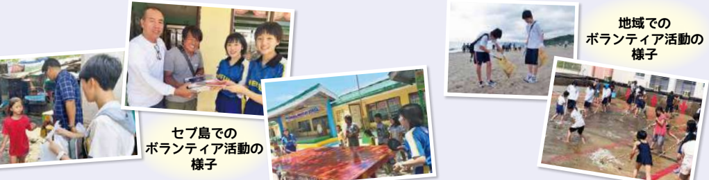
セブ島でのボランティア活動の様子