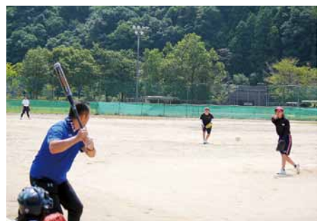
保護者と白熱した試合をする部員たち

久々茂球場にて、ソフトボール部の親子交流試合が行われた。かねてよりの念願が叶った試合である。白熱した熱戦で、投手・打者直接対決もあり、思い出に残るような試合となった。試合後は、保護者の準備で、ハーベキューに舌鼓を打ち、心もお腹も十分満たされた1日となった。