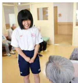
高齢者施設実習の様子

2年生 高齢者施設実習 2年生は、1年次、2年次で行ったことを踏まえて高齢者施設での11日間の実習を行った。食事介助や排泄介助なども実際に行い、貴重な体験をさせていただいた。今回の実習での経験を今後を生かし、更なる成長を期待したい。