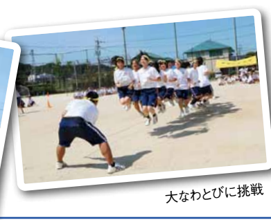
大なわとびに挑戦