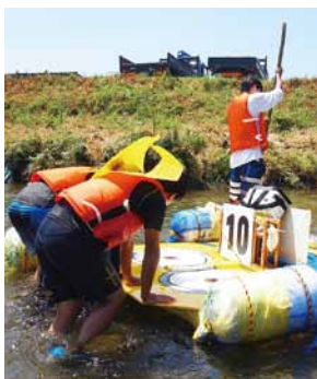
いかだに乗って川を下る生徒たち

今年の夏、通信制課程の生徒は2つの大きな大会に挑戦した。1つめは、清流高津川いかだ流し大会(7月30日)。約4時間の過酷なレースを耐え抜き、審査員特別賞に輝いた。2つめは、8月12日に高知県安芸市で開催された「商い甲子園」(高校生による商品販売競技大会)。益田市特産の菓子を中心に販売し、23チーム中9位入賞(審査員特別賞)を果たした。