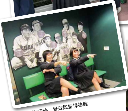
グループ別研修 野球殿堂博物館