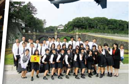
皇居前広場(二重橋)