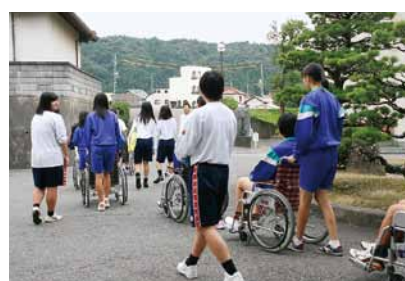
福祉科車イス体験をする中学生たち

科試験を重視した入試制度。公立高校に準じた出題傾向で、英語のリスニング問題も出題する。受験会場は明誠高校と、浜田県立大学の2会場とする。