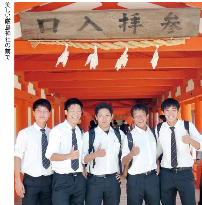
美しい厳島神社の前で

く写真を撮り合った。1年生にとっては初めて全体で校外に出かける行事であり、楽しみにしていた生徒たちも多かった。バスの中でも、フェリーの中でも、笑い声が常に響き、お土産を鹿に引っ張られるというアクシデントも思い出になったようだった。