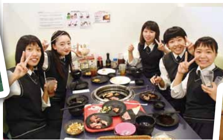
焼肉バイキングの昼食