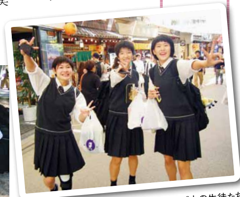
宮島でショッピング中の生徒たち

自己推薦入試 学力だけでは測れない個性や目的意識、熱意・意欲を重視した入試制度で、書類審査と面接で判定される。なお福祉科希望