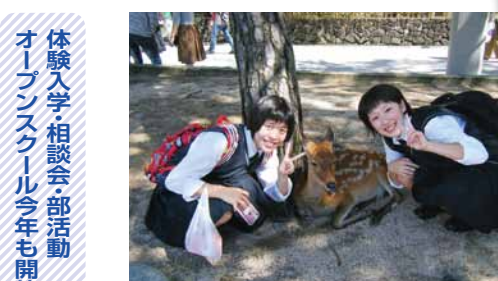
宮島名物「鹿」と一緒にポーズ

8月と10月に実施された体験入学2017は350名を超える中学生の皆さんの参加があり、大盛況のうちに終了した。現在は12月16日(土)まで毎週土曜日に、相談会と、部活動オープンスクールが開催されている。相談会では入試や、学校生活、費用に関する相談などをなんでも個別に受け付けている。また、部活動オープンスクールの様子を体験していただく。いずれも予約受付中。詳しくはHPをご参照。