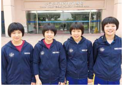
中国卓球学院での4選手

が8月4日～9日まで中国上海にある中国卓球学院へ強化遠征をおこなった。学長は元ナショナルチームの監督、指導スタッフも元世界チャンピオンなど多彩なメンバーで強化活動を行っている。選手4名とも初の海外遠征で緊張気味であったが、少しずつコミュニケーションも取れはじめレベルの高い練習とすばらしい環境に大満足の遠征となった。帰りは飛行機が遅れ東京に1泊するというトラブルに巻き込まれたが、岸総監督は「数日中国に行ったから強くなるということはないが、若いうちに異文化に触れること、コミュニケーションをとることに意義がある。国際関係について考えるきっかけになったと思う。」と語った。