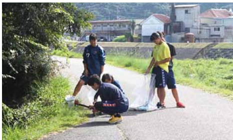
学校周辺のゴミを拾う生徒たち

3ゼロ運動(ゴミ拾い) 毎学期2回行われる、ゴミ拾い運動。今年度も、女子サッカー部を中心に行われている。今回は土手・学校周辺のゴミ拾いを行った。近所の方々から「ここにもゴミがあるので拾って欲しい」、「ありがとうね」など応援していただき、この活動が徐々に浸透しつつある。生徒たちも「誰かボイ捨てするんだろう」、「意識すれば綺麗になるのにな」と話しながら活動をした。「ゴミのない町」を目標に今後もこの運動を続けていきたい。