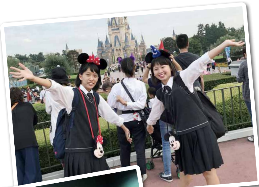
東京ディズニーランド

旅行後に実施したアンケートでは、58%が初めて飛行機に搭乗し、73%が萩・石見空港を初めて利用するなど、時間短縮に合わせて良い経験となった。見学先も多くの箇所満足度が高く、食事もほとんどの方が良好であったとの結果を得た。この結果も参考に、来年度以降も更に充実した東京研修となることを期待される。