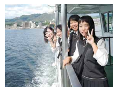
フェリーに乗っていざ宮島へ