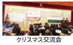
クリスマス交流会

インターアクトクラブは、年間を通して、国際理解と地域社会への奉仕、そしてリーダーの育成を目指して活動している。先日はワイブハーツ主催のクリスマス交流会に参加した。今年で20回目となる。須子町の益田市総合福祉センターに、市内の福祉施設の方々を招待し、5校の高校生たちの手作り料理やケーキで会食をした。またキャンドルサービスマスなどもして、楽しいひと時を過ごし交流を深めた。