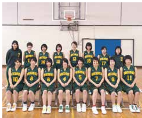
県新人戦準優勝の女子バスケット部

1月9日~11日まで松江市総合体育館を主会場に県新人大会が行われた。準々決勝では、益田高校を相手に苦しい展開だったが、決勝に駒を進めることができた。決勝戦の相手は松江商業高校。オーロコートで果敢にDFを仕掛けたが、後半足が止まってしまい、結果は準優勝。今一歩のところで勝ちきることができなかった。石見地区のチームが今までもこも成し遂げたことがない「県総体優勝」に向けて更なる努力を続けてほしい。