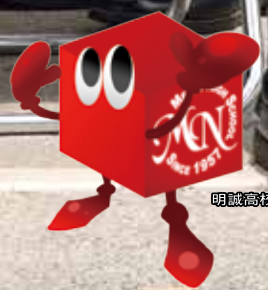
明誠高校マスコットキャラクター キューブ君

MEISEI PLUS COMME ÇA DU MODE School Label