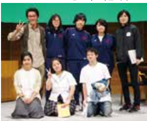
演劇部3団体合同公演

1月24日(日)に、演劇部がグラントワで益田市を拠点にする3団体の合同公演を行った。演劇部は小説「西の魔女が死んだ」(原作:梨木香歩、新潮文庫)を舞台化。中学1年生の女の子が、おばあちゃんとの暮らしの中で「生きる力」を取り戻していく心温まる話。ラストシーンで感動の涙を流す観客もいた。また、他2団体のスタッフとして、照明・音響・舞台をしつかりと支えた。