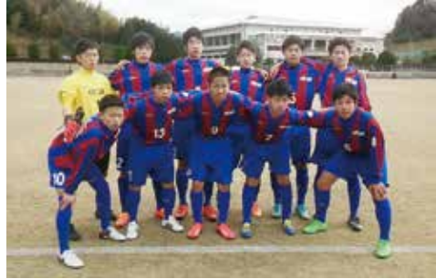
3位決定戦に臨む明誠イレブン

2月14日、県新人サッカー大会において、第3位の成績を収め、みごと中国大会出場を決めた。県選手権に続き、準決勝に駒を進めた。優勝した立正大湘南は、県選手権で負けている相手なので、選手たちは気合十分で試合に臨んだ。決定的なチャンスがいくつかあったが、それを生かすことができず、惜しくも敗れた。3位決定戦では、実力の差を見せつけた展開となった。鈴間監督の指導の下、サッカーの技術だけでなく、戦術面