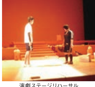
演劇 ステージリハーサル

両同好会では現在、年間最大のイベントともいえる向日葵祭のイベントとともいえる向日葵祭のステージ発表に向け、精力的に練習や準備に取り組んでいる。ダンスは今年3名の新入部生を迎え、見ている観客も一緒に楽しめる人気アイドルグループのダンスや、本格的なヒップホップなどバリエーションに富んだ構成を考えている。また、演劇は、去年よりさらに磨きかけた演技力でのパフォーマンスに期待したい。また、夏のライブイベントでの照明係などのスタッフとしての技術の向上にも力を入れていく。来年度はぜひ部への昇格を！と意気込む両同好会の今後の活躍を祈る。