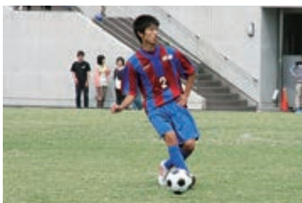
ベスト4進出 男子サッカー部