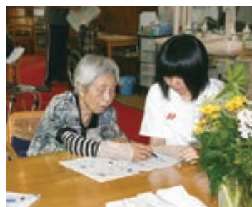
3年生福祉実習の様子

今学期の福祉科の施設実習が無事に終了した。3年生は約1ヵ月間という長期間にわたっての実習で、今年も施設の方には大変にお世話になった。また2年生も種別の違う2つの施設を6日間ずつ計12日間の実習を行い、1年生は高校入学してから初めての実習を緊張の中で行った。