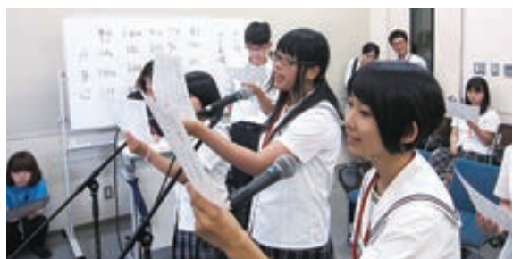
夏休み大阪研修 声優体験講座

第6回夏休み大阪研修が開催された。協力連携校である大阪アニメーションカレッジ専門学校とCATミュージックカレッジ専門学校との協力を得て、今年も一年生から三年生までの希望者21名が参加した。CG・コミック・声優、音楽、ダンスなどそれぞれの興味のある体験をおこない、将来の進路選択の一助となったことである。